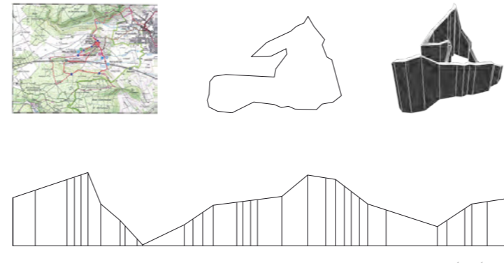
PARCOURS 2 : Prény et Pagny-sur-Moselle

x, y, z / 3 lignes sur plan / angela detanico et rafael lain / agence pièces montées / Commande Publique / Parc Régional Naturel de Lorraine / septembre 2009 /